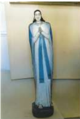
Маці Брожая Беззаганная