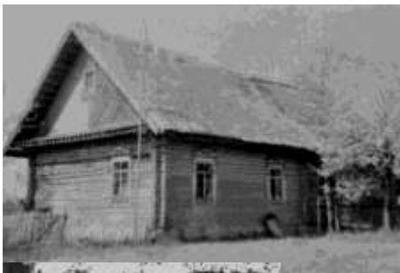
Хата, дзе нарадзіўся Р.С.Памецька

–Рышард Памецька – мой траюрадны брат, радня па майму бацьку Сігізмунду. Бацькі гасцілі ў нас і мы ў іх. А як засталася адна маці Рычарда, то я заходзіла да яе. Мы гутарылі з ёй доўга, расказвала пра сына, нявестку, мы пілі чай, частавала мяне мёдам. Адзін раз з Рычардам хадзілі на танцы ў Спонды. Разумны быў хлопец, кемлівы і мудры. Нездарма ж ён стаў вучоным-фізікам. Ганаруся ім!