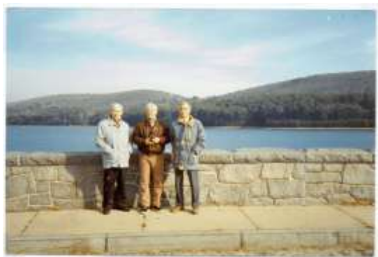
шт. Коннектикут, Аппачи горы, США