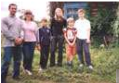
Госці з Калінінграда і Савецка