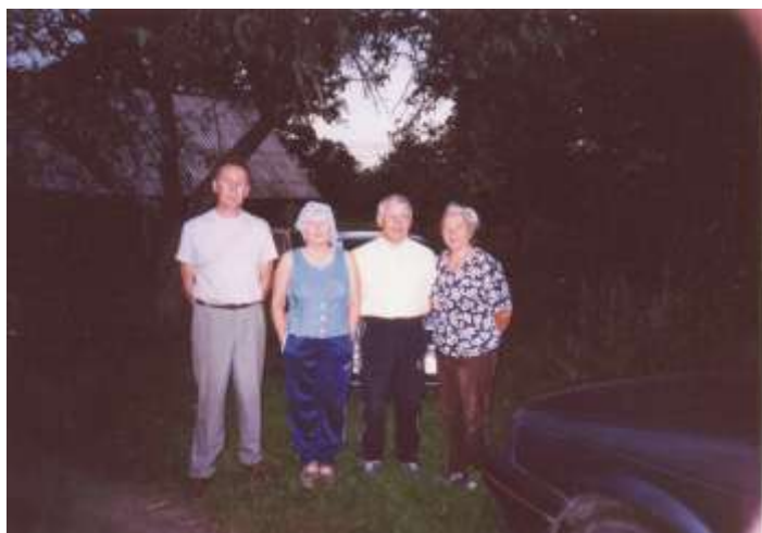
Госці з Вільнюса і Мінска