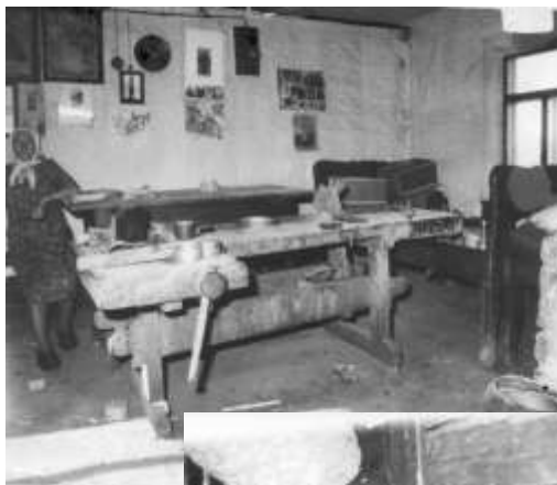
Пакой, у якім жыві і працаваў майстар