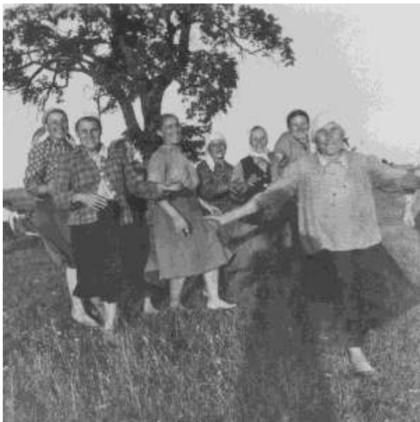
Адзін з фотаздымкаў, якія Рычард рабіў на заказ - дажынкі: святкавала брыгада №3, у якую ўваходзілі чатыры Глушыцы і Акартэлі.