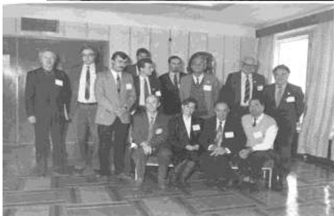
Міжнародны семінар у Обнінску