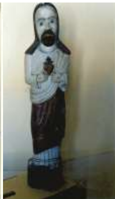
Хрыстос з палаючым сэрцам