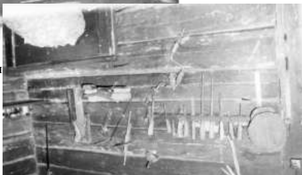
Інструменты, якімі карыстаўся майстар