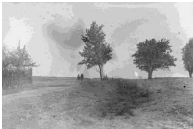
Апошнія з Глушыцы

...А фота так захапляюча прыгожая, такі кранаючы пейзаж! І слядочки на снезе... Здаецца, гэта я прыйшла ў Глушыцу, а там нічога і нікога. І не ведаю, што рабіць... Толькі звонкая цішыня, толькі яснае неба... (з ліста Г.Семашкевіч)