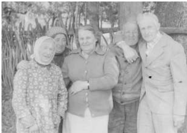
Госці з Латвіі ў Глушыцы. 1986г.