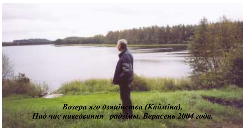
Возера яго дзяцінства (Кайміна). Пад час наведвання радзімы. Верасень 2004 года.