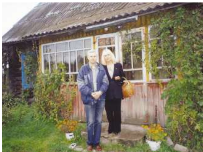
Перад ад'ездам. Верасень 2004 год