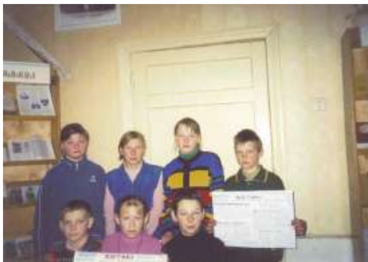
(Рэдкалегія аб’яднання “Бацькаўшчына” з першым выпускам газеты “Вытокі”

Члены “Бацькаўшчыны” арганізавалі выпуск краязнаўчай сценгазеты “Вытокі”. (Караткевіч А. Прэса Спандаўскага маштабу”// Раніца. -2003. – 03 мая.).