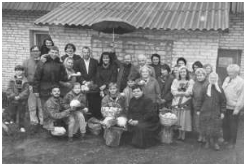
Пасля імшы з нагоды 110-годдзя з д.н. Я.Быліны Ключчанах ў Ключчанскім касцёле)