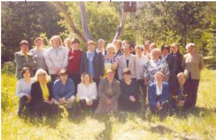
(Семінар па кразнаўстве бібліятэкараў Астравецкай ЦБС у Спондаўскім сельсавеце. 2004г.)

прайшоў кразнаўчы семінар бібліятэчных работнікаў у 2004 годзе. Удзельнікі азнаёміліся з помнікам рэспубліканскага значэння “Камарышкі”, батанічным помнікам прыроды “Старажытны дуб”, рэспубліканскім ландшафтным заказнікам “Сарачанскія азёры”